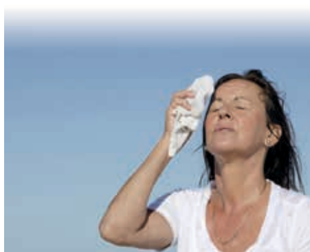
Zu den häufigsten Wechseljahresbeschwerden gehören Hitzewallungen.

Dieses Nutzen-Risiko-Verhältnis ist bei einer reinen Östrogenbehandlung günstiger, so dass hier eine Hormontherapie nach individueller Abwägung möglich erscheint. Derzeit sind Östrogenpräparate zur Vorbeugung einer Osteoporose bei einem hohen Risiko für Brüche nur dann verordnungsfähig, wenn andere Medikamente zur Vorbeugung einer Osteoporose nicht vertragen werden oder kontraindiziert sind. Wenn eine Hormontherapie in Frage kommt, so sollte vor einer Therapieeinleitung in jedem Fall eine ausführliche Beratung mit dem niedergelassenen Frauenarzt erfolgen.